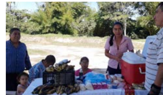
Participantes y asistentes a feria comercial realizada en las instalaciones del Polideportivo del municipio de El Carmen Cuscatlán

Con el propósito de contribuir a la promoción y comercialización de los productos y servicios ofrecidos por las personas con discapacidad que fueron apoyadas en el área de negocios por la Fundación en el año 2015, se realizó una feria comercial en el municipio de El Carmen departamento de Cuscatlán, actividad que fue coordinada de manera conjunta con las Oficinas Municipales de apoyo a la Discapacidad OMADIS de los municipios de El Carmen, Quezaltepeque, San Martín y Tonacatepeque.