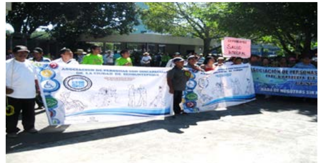
Representantes de asociaciones de personas con discapacidad participando en la conmemoración del día de la discapacidad.

24 Asociaciones de personas con discapacidad fueron apoyadas en el marco de la conmemoración del día nacional e internacional de las personas con discapacidad, realizando actividades en varios municipios del país, con la finalidad de lograr visibilización a nivel local y junto a actores locales unieran esfuerzos para conmemorar este día en los municipios de Quezaltepeque, Comasagua, El Carmen, Oratorio de Concepción, Ilobasco, Guacotecti, Sensuntepeque, Sonsonate, Tonacatepeque, San Martín, Olocuilta, El Congo, Apastepeque, Candelaria, El Puerto de la Libertad, San Luis Talpa, Santo Tomás, Santiago Texacuangos, Panchimalco, Nuevo Cuscatlán, San Bartolomé Perulapía, Zacatecoluca, Suchitoto y San Juan Nonualco. Se calcula que en promedio más de 1,000 personas, entre personas con discapacidad y sus familiares, se incluyeron en las diferentes acciones.