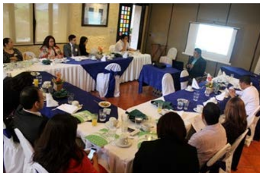
Desarrollo de jornada de sensibilización a empleadores realizada en el mes de julio de 2015.

A nivel de instituciones de apoyo, se tuvieron 2 reuniones con representantes del Instituto Salvadoreño de Rehabilitación Integral ISRI, el Consejo Nacional de Atención Integral a Personas con Discapacidad CONAIPD, el Ministerio de Trabajo y Previsión Social, para dar a conocer la propuesta de implementación del Círculo de Empresas Inclusivas, en apoyo a la inserción laboral de personas con discapacidad, para lo cual se recalzó que cada una de las instituciones invitadas juega un papel importante.