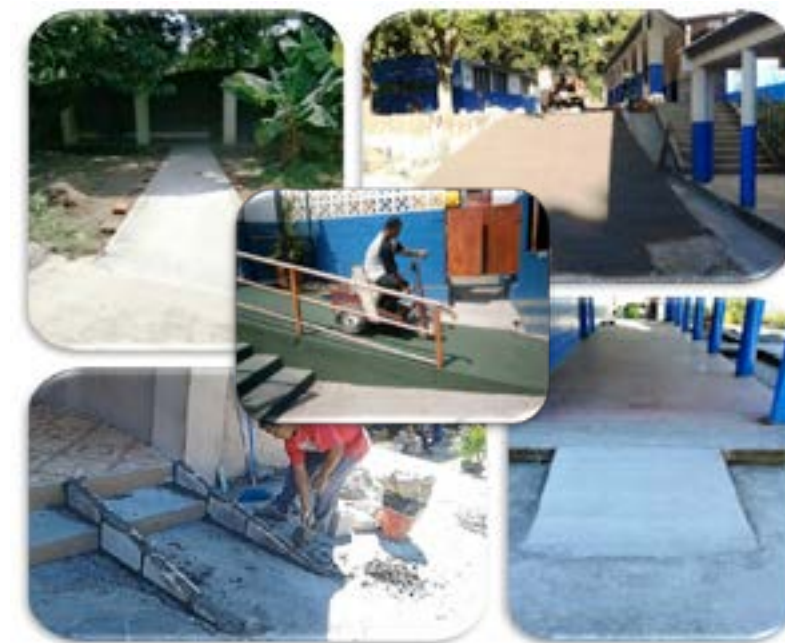
Diferentes rampas construidas en lugares públicos y centros educativos de los municipios de Quezaltepeque, Tonacatepeque y El Carmen

Con estos ajustes las personas con discapacidad de esos municipios se muestran muy satisfechas, porque se ha logrado eliminar las barreras físicas, que ya no les impiden lograr una mejor inclusión en las actividades de la comunidad en donde residen.