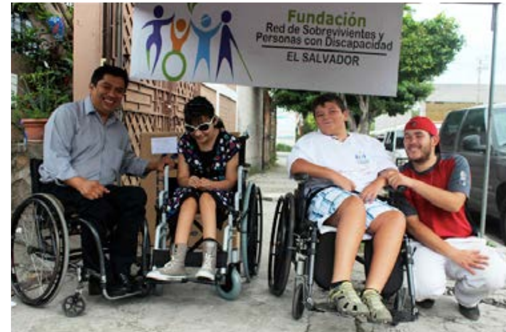
Personal de la Fundación y Hope Haven, entregan silla de ruedas a niñez con discapacidad.

distribuidas de la siguiente manera: a AGAPE se le entregaron 12 sillas de ruedas; a HOPAC 33 sillas de ruedas y la Fundación distribuyó 62 sillas de ruedas a las asociaciones de personas con discapacidad con las que trabaja.