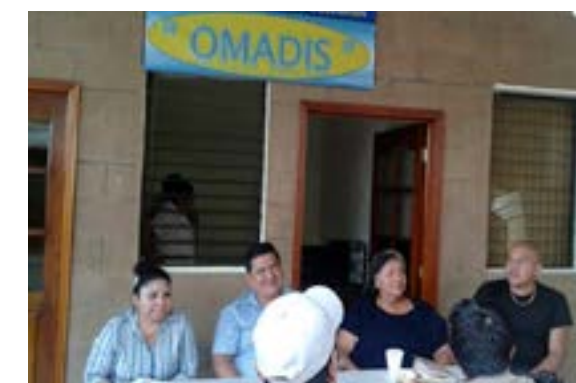
Reunión de personas con Discapacidad, concejales municipales y coordinador de OMADIS de Villa El Carmen Cuscatlán.