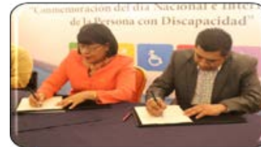
Firma de convenio con Ministerio de Trabajo y Previsión Social y la Fundación Red de Sobrevivientes y Personas con Discapacidad.