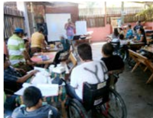
Miembros de la Asociación de Personas con Discapacidad de Olocuilta recibiendo capacitación en Liderazgo

24 Asociaciones de personas con discapacidad fueron apoyadas en el marco de la conmemoración del día nacional e internacional de las personas con discapacidad, realizando actividades en varios municipios del país, con la finalidad de lograr visibilización a nivel local y junto a actores locales unieran esfuerzos para conmemorar este día en los municipios de Quezaltepeque, Comasagua, El Carmen, Oratorio de Concepción, Ilobasco, Guacotecti, Sensuntepeque, Sonsonate, Tonacatepeque, San Martín, Olocuilta, El Congo, Apastepeque, Candelaria, El Puerto de la Libertad, San Luis Talpa, Santo Tomás, Santiago Texacuangos, Panchimalco, Nuevo Cuscatlán, San Bartolomé Perulapía, Zacatecoluca, Suchitoto y San Juan Nonualco. Se calcula que en promedio más de 1,000 personas, entre personas con discapacidad y sus familiares, se incluyeron en las diferentes acciones.