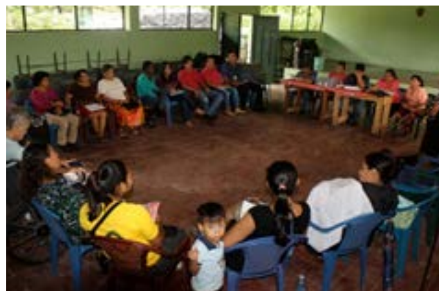
Grupo GLAC del municipio de Santiago Texcuangos