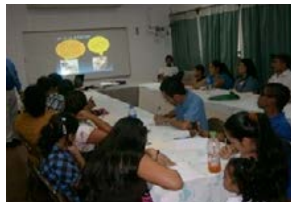
Capacitación sobre el tema de autoestima, realizada en las instalaciones de AGAPE- Sonsonate.