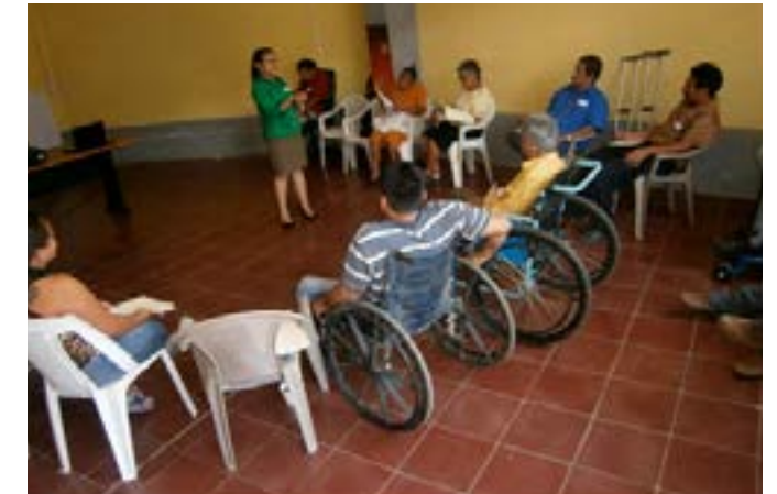
Capacitación en Administración de negocios, realizada en el municipio de Suchitoto - Cuscatlán

Dentro de las temáticas impartidas se encuentran: servicio al cliente, registros básicos, administración de negocios, formulación de planes de negocio, emprendedurismo, mercadeo y ventas, entre otras.