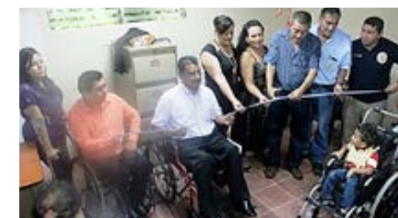
Acto de Inauguración de la Oficina OMADIS del municipio de Tonacatepeque, con la participación de Alcaldía, Asociación de personas con discapacidad y Fundación Red de Sobrevivientes.

Las 3 nuevas oficinas cuentan con el respaldo municipal y de las asociaciones locales de personas con discapacidad. Estas instancias conjuntamente con la Fundación Red de Sobrevivientes , continuarán contribuyendo a mejorar las condiciones de vida de las personas con discapacidad que se benefician de estos servicios de atención.