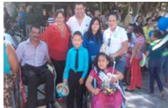
Commemoración del día de la discapacidad en Tonacatepeque.