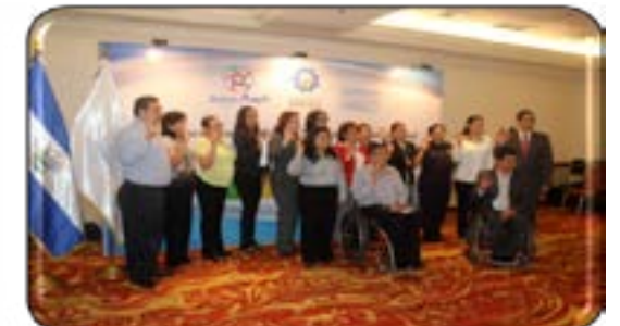
Juramentación de la Comisión de Inserción Laboral de Personas con Discapacidad, a cargo de la Licda. Sandra Edibel Guevara Pérez, (Ministra de Trabajo).

En el marco de la colaboración para contribuir a la empleabilidad de las personas con discapacidad del país, y tomando como base la Ley de Equiparación de Oportunidades para Personas con Discapacidad, que en su artículo 24, obliga a los empleadores a que por cada 25 personas que laboran, se debe de contratar a 1 persona con discapacidad y en el marco de la conmemoración del día nacional e internacional de las personas con discapacidad, el día 10 de diciembre de 2015, la Licda. Sandra Edibel Guevara Pérez en representación del Ministerio de Trabajo y Previsión Social y la Fundación, firmaron el convenio de colaboración entre ambas instituciones, donde se comprometieron a trabajar conjuntamente para mejorar las condiciones de empleabilidad de las personas con discapacidad, poniendo a disposición recurso institucionales y la facilitaciones de los procesos en intermediación laboral.