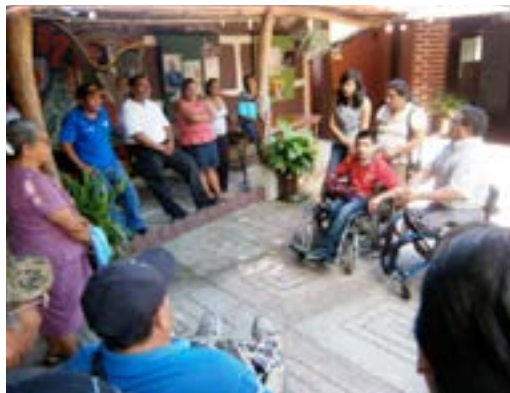
Miembros de la Asociación de Personas con Discapacidad de Panchimalco, recibiendo capacitación en Derechos Humanos

Proyectos Sociales; los cuales se llevaron a cabo con personas con discapacidad en los municipios de Panchimalco, San Bartolomé Perulapía, Nahulingo, Tonacatepeque, Zacatecoluca, San Martín, Santiago Texacuangos, Sensuntepeque y Quezaltepeque, a través de los cuales un total 354 personas con discapacidad fueron formados sobre esas temáticas.