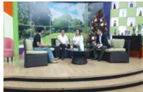
Participación del personal técnico de la Fundación, en el programa Hola El Salvador.