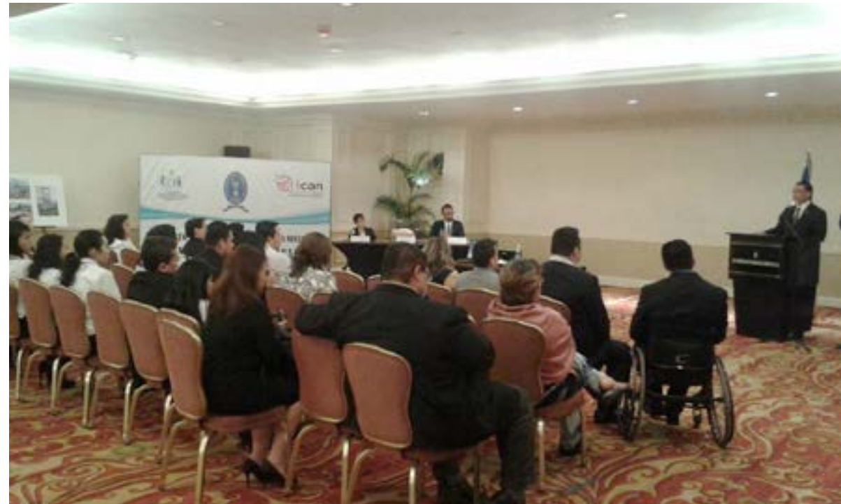
Asistentes al Foro Impacto humanitario: Una visión desde El Salvador.

realizó el 26 de noviembre de 2015 en el que participaron representante de instituciones públicas, ONGs, universidades e invitados especiales.