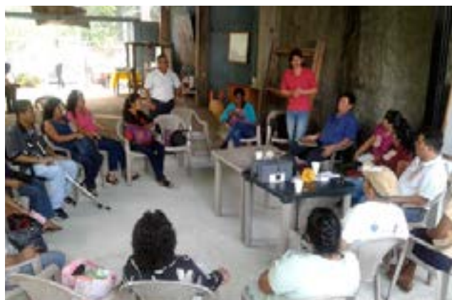
Grupo GLAC del cantón El Rosario del municipio de Tonacatepeque

Estos grupos son un modelo mixto e inclusivo, que incluye la participación de personas con y sin discapacidad y tienen como propósito contribuir a la educación financiera y de generar recursos a través del ahorro que sirvan como un fondo de crédito para solventar las necesidades crediticias de las personas de escasos recursos económicos, que no tienen acceso al sistema de crédito bancario.