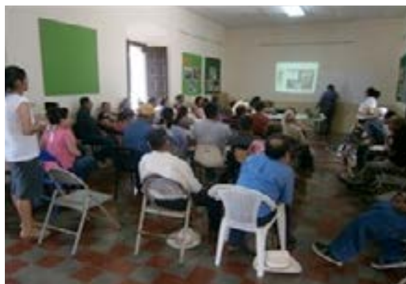
Capacitación sobre autoestima y salud emocional realizada en el municipio de Sensuntepeque, Cabañas.

Con este esfuerzo se ampliaron las relaciones de colaboración con los equipos multidisciplinares de los hospitales, a quienes también se les orientó acerca del trato y abordaje de las personas con discapacidad.