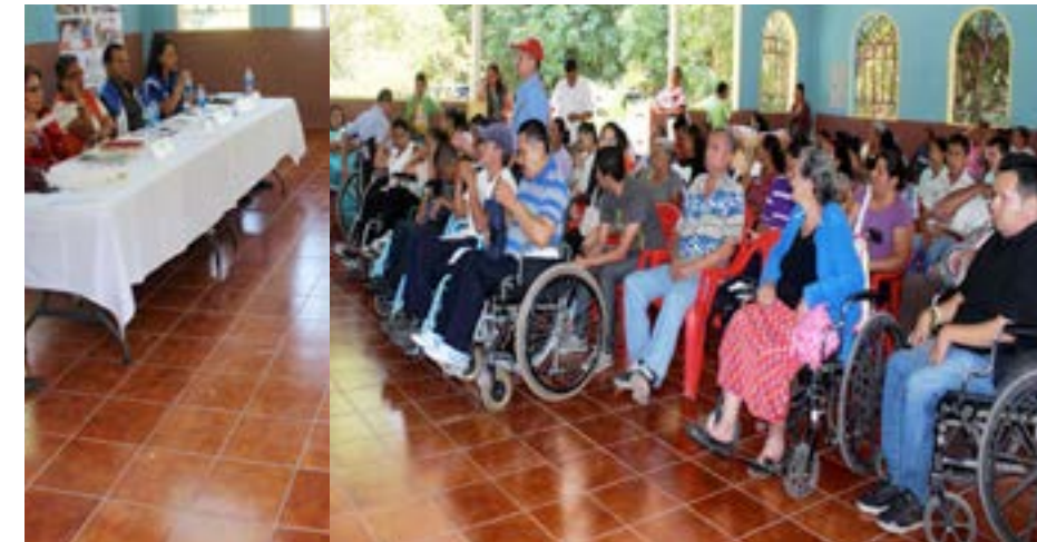
Foro de candidatos a alcaldes, realizado en el municipio de Tonacatepeque, sobre el tema: "Apuestas de gobiernos locales en torno al tema de discapacidad"

Los foros fueron realizados en los municipios de San Martín, Tonacatepeque, El Carmen, Quezaltepeque, Nuevo Cuscatlán y Comasagua. Entre los compromisos adquiridos podemos mencionar: Crear o continuar apoyando las OMADIS, hacer accesibles los municipios, apoyar eventos de las asociaciones de PCD, así como en el área de empleabilidad de PCD, entre otros.