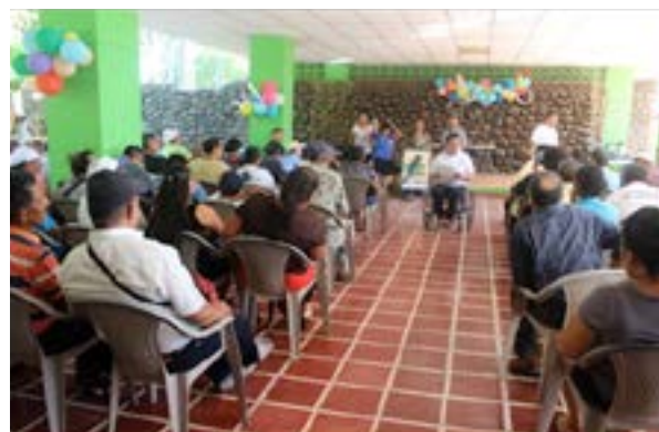
Segundo encuentro realizado en Puerto de La Libertad