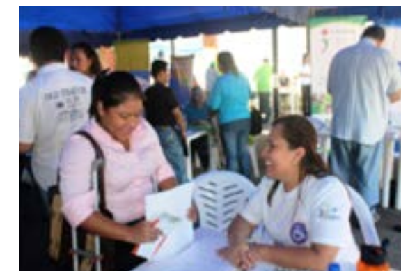
Coordinadora de la Unidad de Inserción Laboral UNIL, brindando orientación a personas con discapacidad que asistió a la feria de empleo.

A la actividad se hicieron presentes 35 empresas que ofertaron 535 plazas de empleo, tales como: Servicio al cliente, paqueteros, limpieza, ventas, operarios, servicios de seguridad privada, operadores de Call Center entre otros. Dentro de algunas de las empresas que participaron se destacan: Atento, Almacenes Simán, AFP Confía, INTRADESA, Industrias La Constancia, Telefónica, Banco Agrícola, entre otras. Al evento asistieron 129 personas con discapacidad.