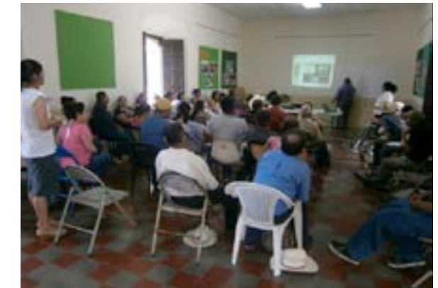
Capacitación de salud sobre autoestima e inteligencia emocional desarrollada en el municipio de Sensuntepeque, departamento de Cabañas.

auto cuidado personal y el manejo de las emociones derivadas por la discapacidad.