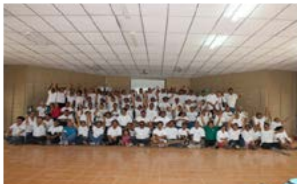
Primer encuentro realizado en San Salvador

En ambos casos, las personas asistentes a cada evento fueron representantes de las Juntas Directivas que durante el año se caracterizaron por su liderazgo, identificación con la fundación y el buen trabajo a favor de las personas con discapacidad.